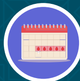
Haid dan Nifas