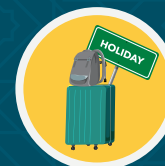
Orang yang bermusafir