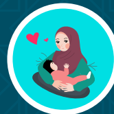
Ibu menyusukan anak